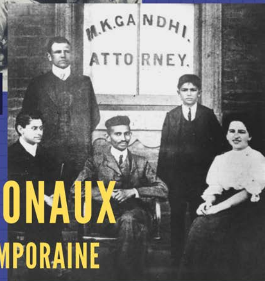
Gandhi (au centre) et ses collègues devant son cabinet d'avocat à Johannesburg en Afrique du Sud, 1905.