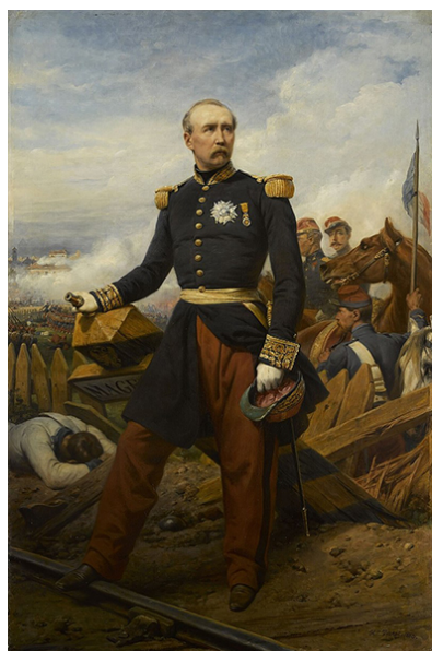
Le Maréchal de Mac-Mahon