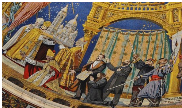
Le Vœu National au Sacré-Cœur (mosaïque de la basilique de Montmartre)